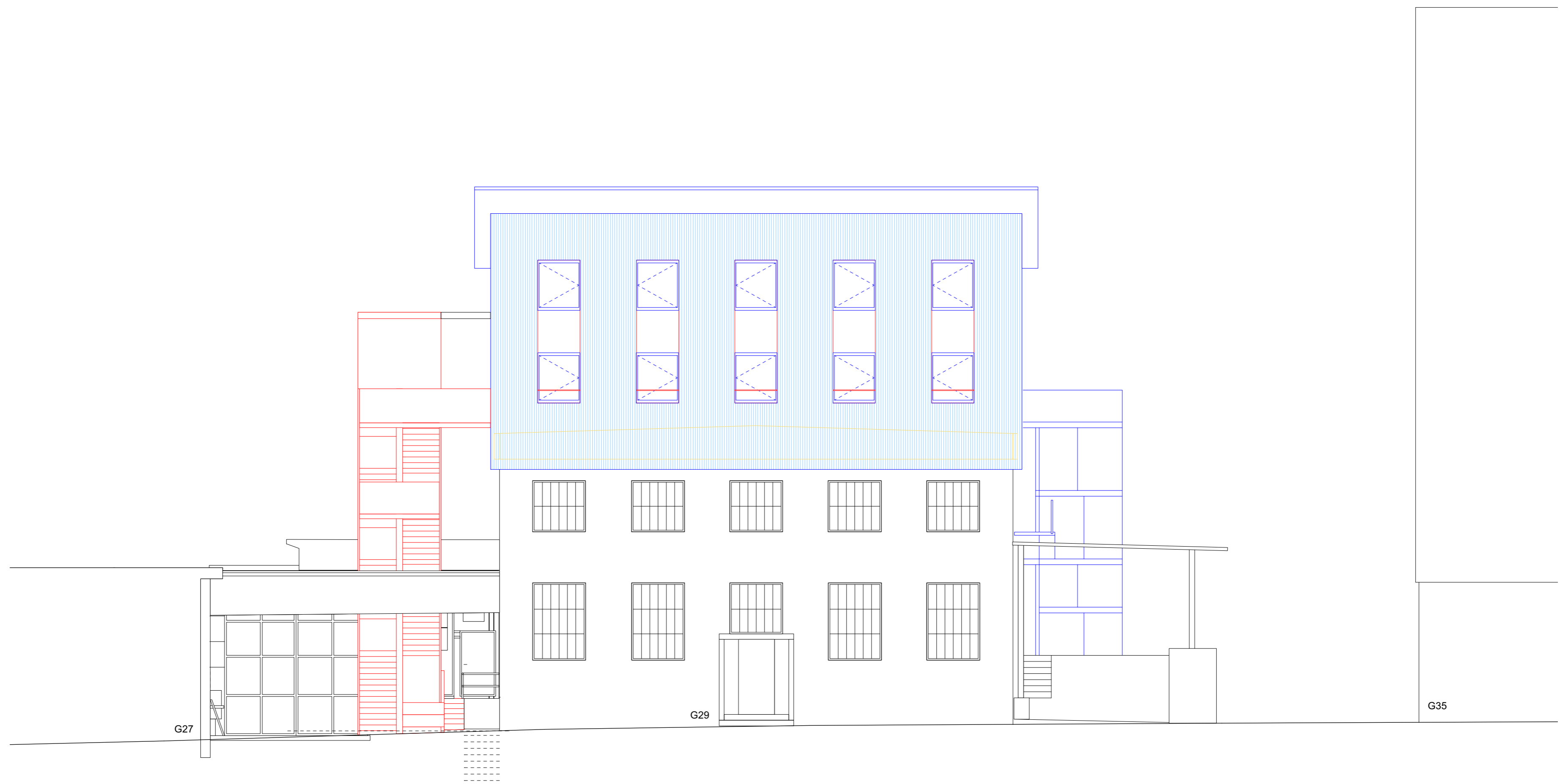
Ansicht - Nord