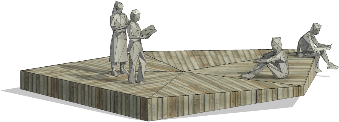
3D Ansicht Materialisierung