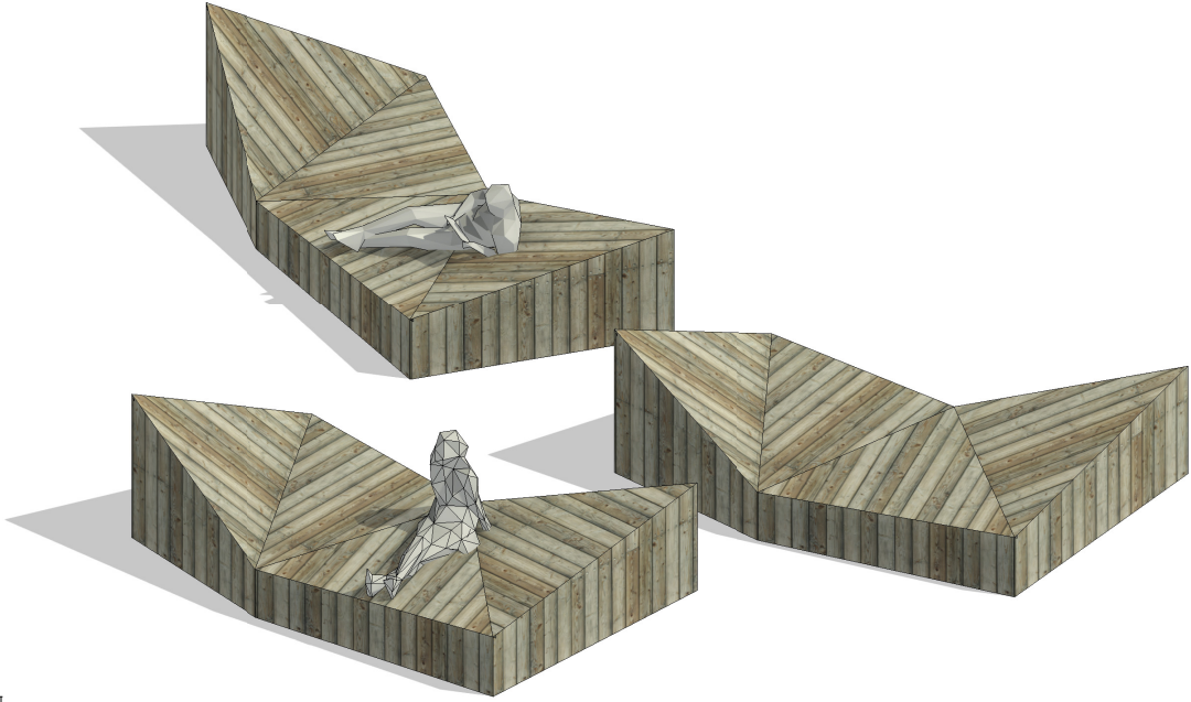
3D Ansicht Materialisierung