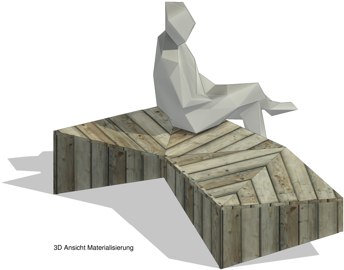
3D Ansicht Materialisierung

Seebahnstrasse 85 | 8003 Zürich Telefon 044 450 35 00 | Fax 044 450 35 01 werknetz.ch Dipl.Architekten ETH/SIA