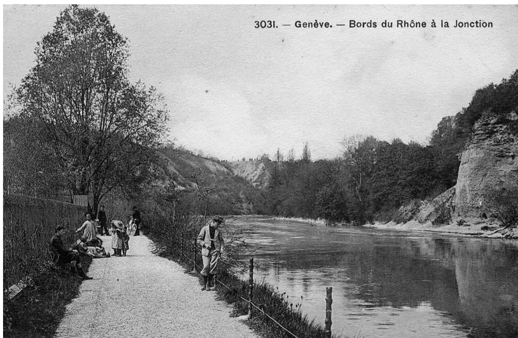
PHOTOGRAPHIE HISTORIQUE (ca. 1910-1920)

À cet effet, plusieurs aménagements s'installent sur le rivage et sur la place de façon ponctuelle, comme une pataugeoire, des fontaines à eau, des installations de brumisations et divers autres espaces ludiques pour les enfants. Lors de fortes chaleurs d'été, ce dispositif améliore le bien-être des usager.ère.s et renforce le caractère convivial et festif de l'ensemble.