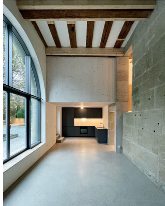
24 Ehemalige Makkaronifabrik, Ittigen Ancienne fabrique de macaronis, Ittigen