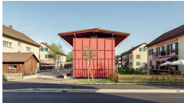
32 Wohnkolonie Hard, Langenthal Quartier d'habitation du Hard, Langenthal