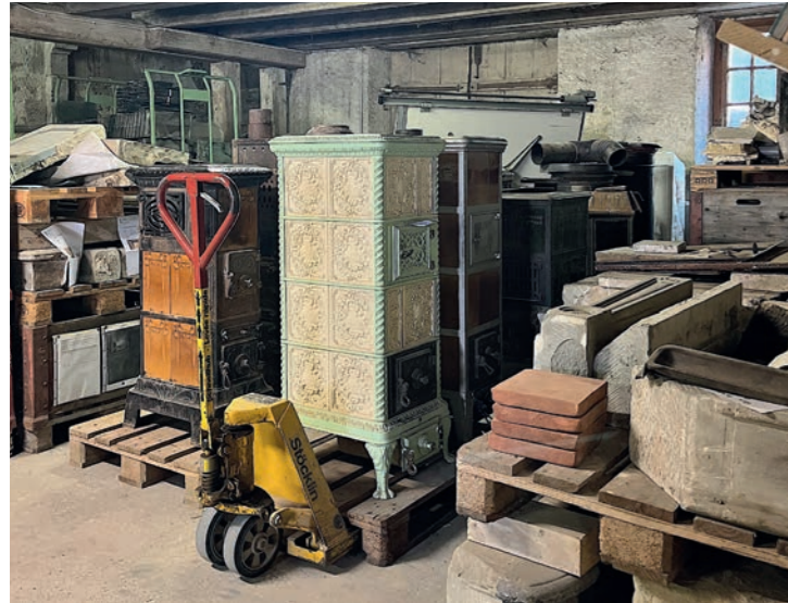
4 Bauteillager, Münchenbuchsee Dépôt d'éléments de construction, Münchenbuchsee