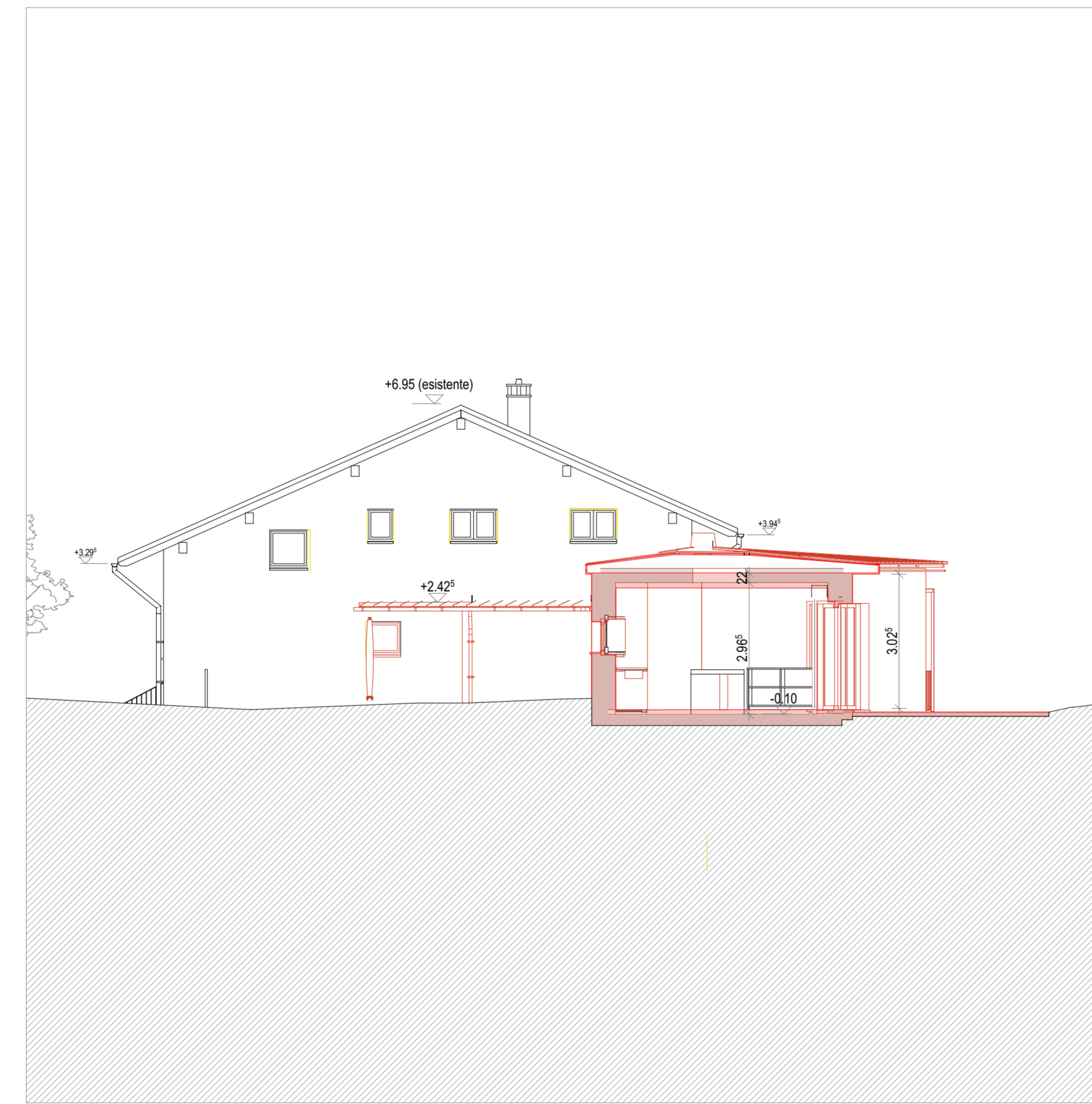
SEZIONE B - B' 1:100