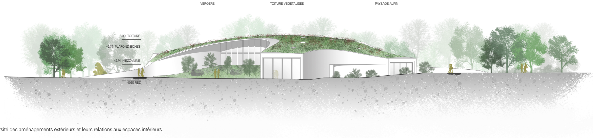
Élévation Sud montrant la diversité des aménagements extérieurs et leurs relations aux espaces intérieurs.